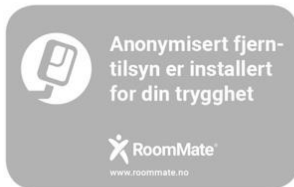
Figur 4, Informasjonsskilt

Ved inngangen til rom hvor RoomMate er montert kan det settes opp medfølgende selvklebende informasjonsskilt. Vanligvis plasseres skiltet på døren over dørhåndtaket eller i umiddelbar nærhet til døren.