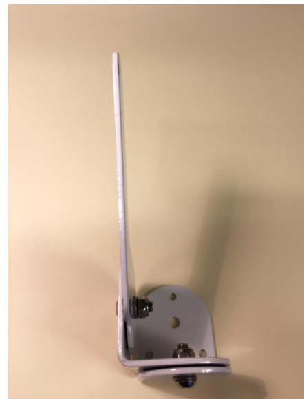
Figur 3. Feste for dreining mot klokken.

Dersom det vedlagte festet er levert med feil sammenstilling må det bygges om ved at knaggen frigjøres, braketten vris til motsatt side før knaggen monteres på igjen. Det er svært viktig at knaggen monteres på riktig side av braketten som vist over slik at knaggen ikke kan dreie rundt og RoomMate-sensoren faller ut av feste.